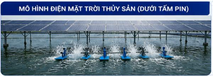
MÔ HÌNH ĐIỆN MẶT TRỜI THỦY SẢN (DƯỚI TẮM PIN)