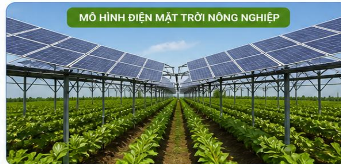
MÔ HÌNH ĐIỆN MẶT TRỜI NÔNG NGHIỆP